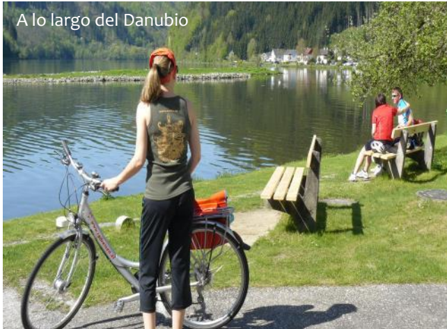
A lo largo del Danubio

Llegada individual a Passau y traslado por cuenta propia al hotel. Alojamiento, tienes tiempo para poder darte un paseo por el pintoresco casco antiguo y conocer la ciudad.