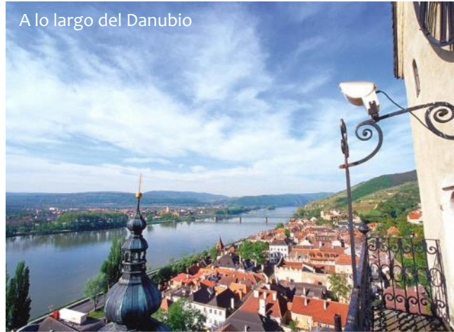
A lo largo del Danubio